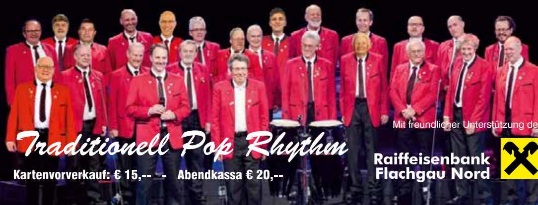
Traditionell Pop Rhythm

Kartenvorverkauf: € 15,- - Abendkassa € 20,-