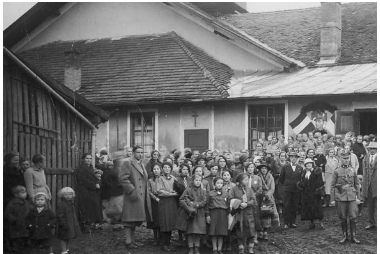
Notkirche in der ehemaligen Glasfabrik

Im Jahr 1928 gab es Bestrebungen, in Bürmoos regelmäßige Sonntagsgottesdienste zu halten. Das Pfarramt Lamprechtshausen ersuchte um Überlassung eines Zimmers im Schulgebäude zur Abhaltung von Gottesdiensten. Dieses Ansuchen wurde jedoch von den Bürmooser Vertretern in der Gemeinde mit der Feststellung abgelehnt, „dass 99 % von der Arbeiterschaft einen Gottesdienst nicht wünschen und gegen die Abhaltung eines solchen protestieren“ . Sie vertraten die Ansicht: „Vom Beten und in die Kirche gehen werden wir nicht satt. Wir brauchen für die vielen lungenkranken Arbeiter ein Tuberkulosenheim und ein Altersheim“ .