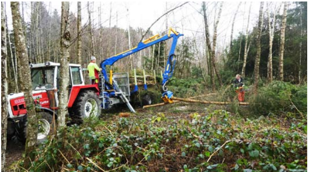
Das sehr ungepflegte und verwilderte Grundstück konnte nur mit Maschineneinsatz grob bearbeitbar gemacht werden

Daraufhin wurde unter finanzieller Beteiligung der Gemeinde und unseres Vereins seitens der Naturschutzbehörde ein gerichtlich beeideter Sachverständiger bestellt, der in seinem Gutachten einen für beide Seiten akzeptablen ortsüblichen Preis ermittelt hatte.