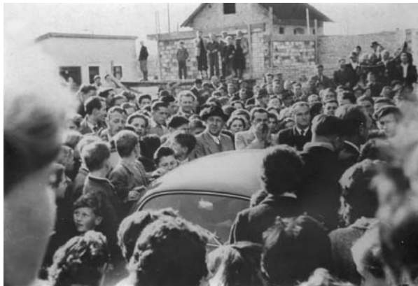
Bei der feierlichen Turmkreuzsteckung kam es zu tumultartigen Szenen. Die Teilnahme bei den Gottesdiensten ging dramatisch zurück

Die Kirche war um Beruhigung bemüht und erklärte, dass ausschließlich kirchenrechtliche Gründe dafürgesprochen haben, dass Pater Felix nicht die neue Pfarre Bürmoos leiten könne. Bürmoos wurde bisher seelsorglich von Lamprechtshausen und diese vom Benediktinerkloster Michaelbeuern geleitet, nun aber würde Bürmoos eine weltliche Pfarre unter Leitung der Erzdiözese werden. Pater Felix, als Angehöriger des Benediktinerordens, könne daher nicht Pfarrer sein.