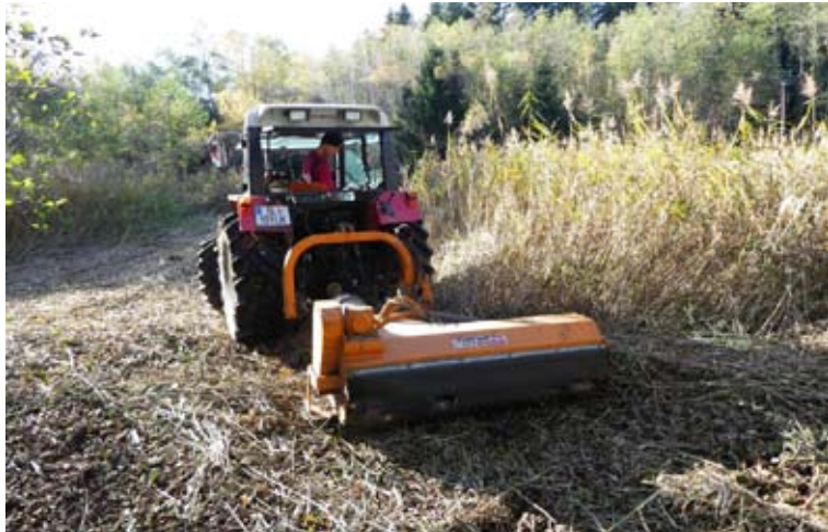
Bis zu zwei Meter hohes Schilf konnte nur an trockenen Tagen gemäht und abtransportiert werden

Allerdings musste das Land den Kauf vorläufig zurückstellen, weil die finanziellen Mittel erst gesichert werden mussten. Dies zog sich leider über mehrere Monate dahin. Ob es tatsächlich zum Ankauf kommen würde, blieb mehr als ungewiss. In dieser Situation richtete unser Verein ein Schreiben an die