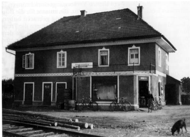
Im alten Stadlerhaus wurde in zwei Räumen eine sparsamst ausgestattete Notkirche betrieben