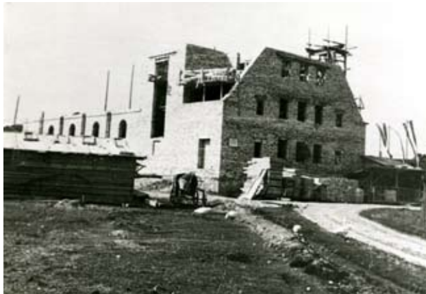
Der Kirchenbau ging mit Hilfe von vielen freiwilligen Helfern rasch voran